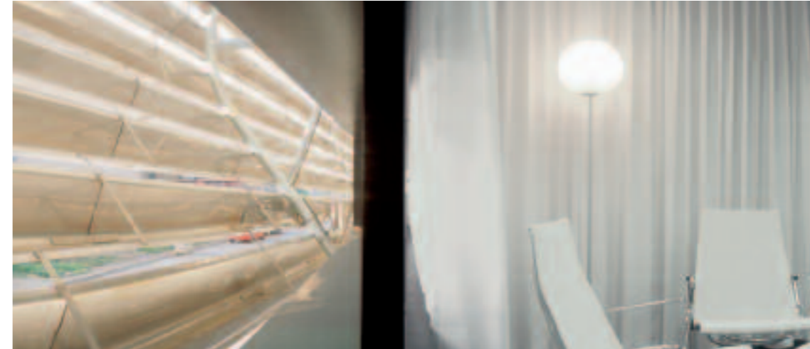
▲ BMW Motor Munich, proyecto de Xavier Claramunt, foto de Adrián Goula

En España aún no se ha tomado conciencia de la importancia de la iluminación: en las escuelas todavía se usan fluorescentes de luz día