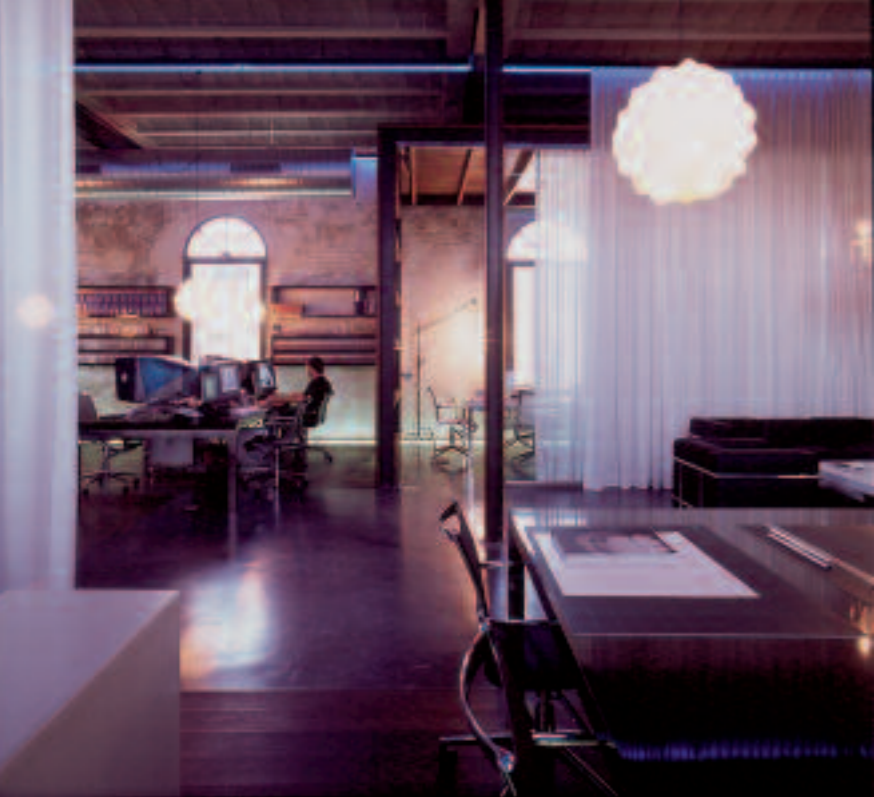
▲ Estudio Laiguana, proyecto de Xavier Claramunt, foto de Jaume de Laiguana

tribuyen a la creación del contraste necesario para una buena concentración. La iluminación asimétrica, en cambio, dirige los rayos de luz en modo indirecto y a lo largo de toda la superficie de trabajo, su distribución es uniforme y no produce sombras.