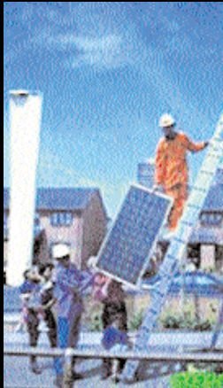
HABANA - Foto de Frank Kalero

En 1937, en Espenhaim (antigua RDA) se construyó una central transformadora de lignito que llegó a generar el 7% del total de emisiones de dióxido de carbono emitidas por el régimen comunista. Lo que fue un auténtico y peligroso vertedero se ha convertido en el eje más limpio de Europa en forma de gigantesca central solar. Consta de 33.500 paneles solares modulares monocristalinos con una capacidad de producción de 5 MW, y abastecerá a 1.800 hogares al día. Es la mayor del mundo y por sí sola evitará la emisión de 37.000 toneladas de dióxido de carbono al año. Así, el futuro de la energía solar en Alemania es esperanzador... Las energías alternativas son el futuro, pero en regiones como ésta, donde el desempleo alcanza al 19,3% de la población, la energía limpia no es tan bienvenida como sería deseable, pues la nueva planta solar está totalmente automatizada. ¿Ironías del progreso?