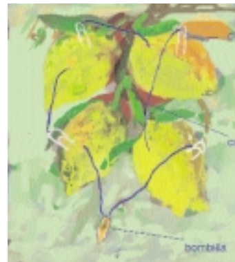
ilustración de Rubén García

¿Cuántas "pilas hidroeléctricas de limón" llevará encender un foco? Para averiguarlo necesitaremos 4 limones, 4 alambres de cobre rígidos, 4 clips grandes y un foco de menos de 1,5 voltios. Si hay algún aislante en las puntas de los alambres, quítalos, desdobra el clip y únelo a la punta de cada uno de los alambres. Aprieta los limones para aflojar su pulpa y haz dos pequeños cortes en la piel de cada uno. Clava el alambre y el clip en la piel de cada limón, uniéndolos como en la ilustración. Ambos (el de cobre y el del acero del clip) deberán quedar cerca el uno del otro, sin tocarse. Terminar con 2 extremos de los alambres libres, uno enlazado a un clip. Conecta estos extremos al foco... y verás que se enciende gracias a las reacciones químicas de los metales diferentes (el cobre del alambre y el acero del clip) en el ácido (jugo de limón) que sacan electrones de un alambre hacia el otro.