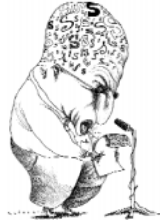
Ilustración de Medona's

Firmada en medio del río más caudaloso del mundo por 24 países, la reciente Declaración del Amazonas propone reducir la pobreza en la región mediante la potenciación del turismo ecológico dentro de un desarrollo económico sostenible. Surgió de la Segunda Cumbre Iberoamericana de Turismo y Medio Ambiente que se celebró en Iquitos, la capital de la región selvática de Loreto (Perú) e incluye 26 acuerdos conjuntos para "incorporar medidas que favorezcan la reducción de la pobreza en las estrategias generales de desarrollo sostenible del turismo, como un instrumento de contribución al desarrollo rural". Además se "insta a los países pertenecientes a la Cuenca Hidrográfica del Amazonas a resaltar el papel crucial de ésta en el ciclo del agua y la conservación de la biodiversidad a nivel regional y global". La propuesta parece buena, pero habrá que ver si el turismo está a la altura.