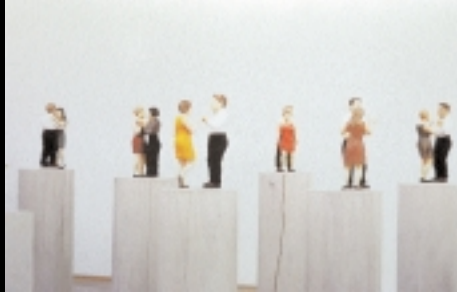
ARCO 20 aniversario

El conflicto palestino-israelí está convirtiendo Oriente Medio en un auténtico polvorín. Muertos en las calles, hombres-bomba, atentados selectivos... asentamientos ilegales, casas derribadas en represalia... Ante la desidia política, muchas entidades no gubernamentales tratan por todos los medios de aportar su grano de arena a una situación desquiciada. Arquitectos Internacionales por la Paz es una de ellas; en colaboración con Naciones Unidas han solicitado a Israel que ponga fin a los asentamientos ilegales en Cisjordania y a los asesinatos selectivos, mientras que, por otra parte, a Palestina le piden que ponga fin a su terrorismo indiscriminado con un gobierno menos beligerante.