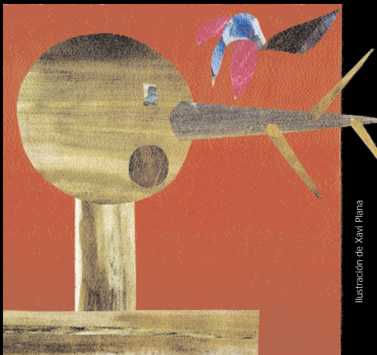
Ilustración de Xavi Plana