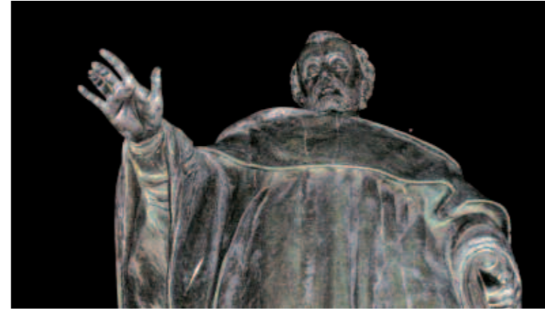
Estatua de Fray Luis de León en el Patio de las Escuelas de Salamanca.

Exactamente. Yo estaba trabajando la figura de Felipe II y, al saberlo, un colega me preguntó si yo era carca. Bueno, carca será cómo trate el tema, no el tema en sí, pero sin embargo, él no había leído mi trabajo. Pero no fue esa la única vez que me tacharon de carca, llegaron a criticar un trabajo mío sobre Copérnico diciendo que era el típico